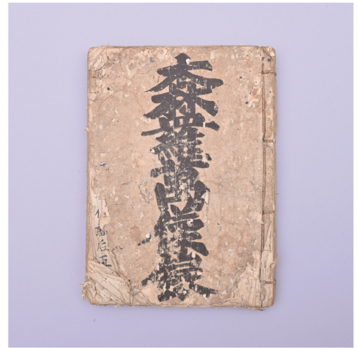
森羅万像録(常楽寺蔵)

本 展では、そんな「未指定文化財」の中から名乗りを上げた、「指定文化財」にも負けちゃいけない、魅力たっぷりな文化財たちをピックアップ! 有田の意外な文化財たちが一堂に会します。