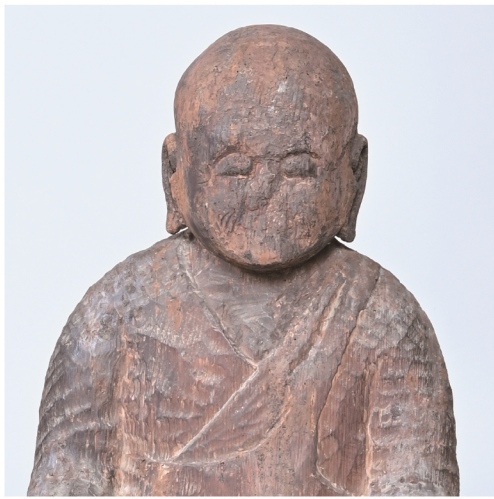
木造僧形坐像(仁平寺蔵)