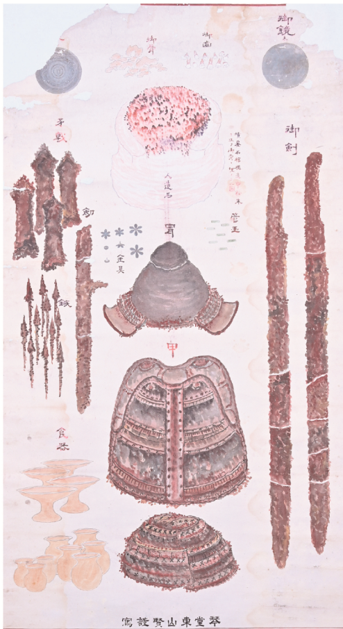
寓 鏡 賢 山 東 堂 琴