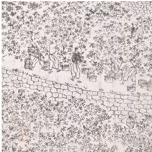
『紀伊国名所図会』(部分、館蔵)