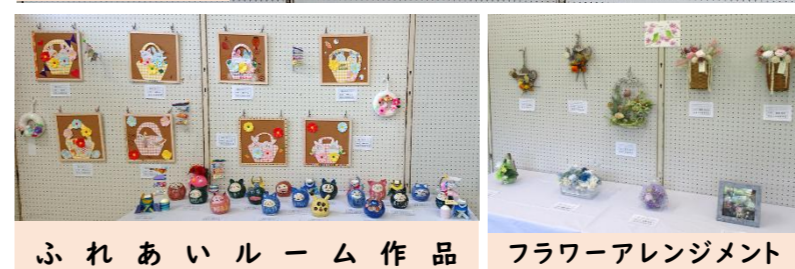
ふれあいルーム作品