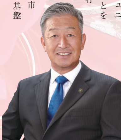
有田市長 久登 玉木

まちづくりは行政だけでなく、市民一人ひとりと、また事業者の皆様の協力なくしては成し遂げられません。持続可能な社会を実現するために、市民、事業者、行政が手を携え、共に創り上げる未来に向け