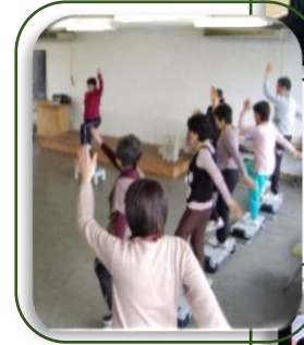
いきいき百歳体操