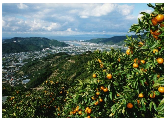
②和歌山県有田市のみかん山