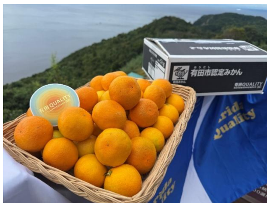
①有田市認定みかん