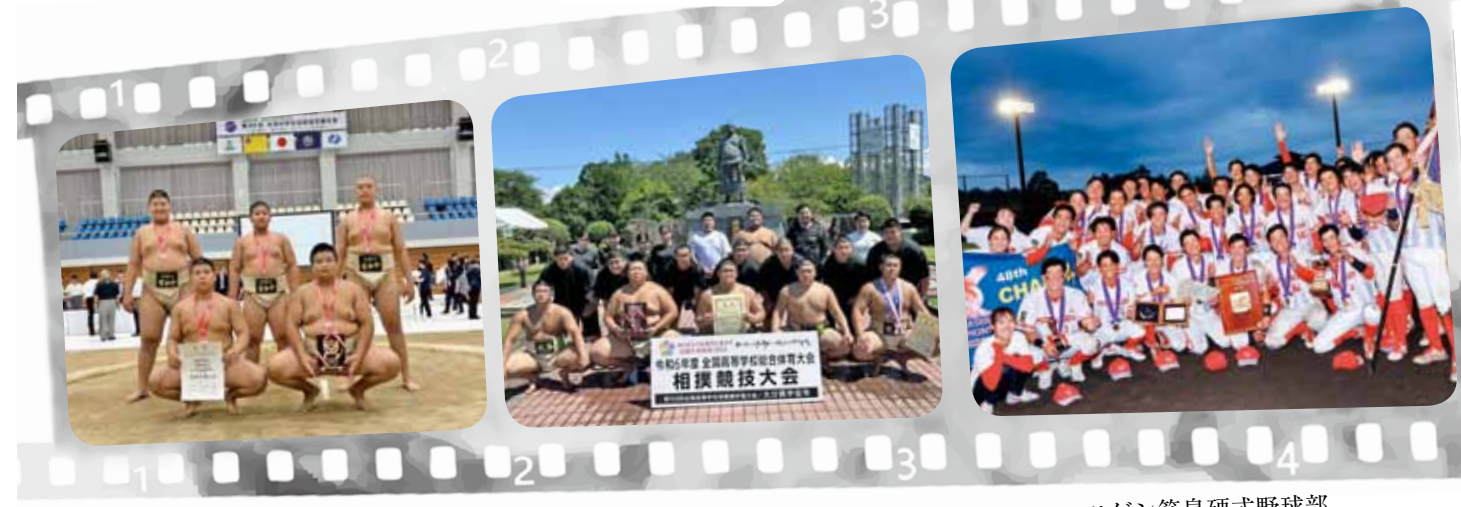
有和中学校 相撲部