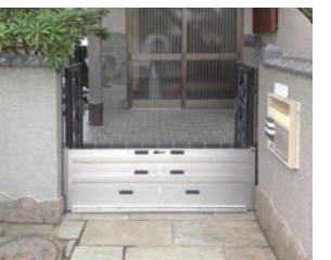
図 防災安全課 Tel22-3721