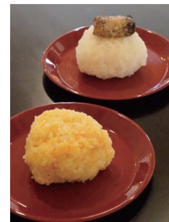
上：太刀魚おにぎり 下：みかんおにぎり

LOCAL JAPAN展では、有田市を含む全国5市と、日本の食の素晴らしさを伝える「おにぎり神谷」がコラボレーションし、各地域の個性豊かな特産品を使った、ここぞしか味わえないスペシャルなおにぎりを提供します。