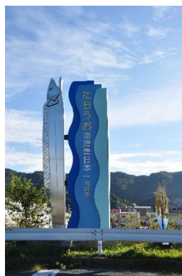
図3 太刀魚モニュメント