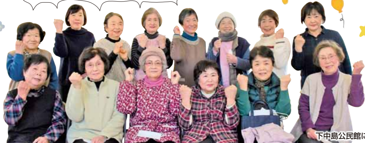
下中島公民館にて

問 歩いて行ける距離でいきいき元気にいきいき100歳体操の主な特徴は、 ①座ってゆっくり行い、もりの調節が可能なので、参加者間での体力の差が多少あっても同じように参加できること ②歩いて行ける距離に開設することを目標にしているため、車や自転車を使わなくても行ける通いの場であることです。 現在市内32か所で開催中で、4月からはさらに1か所開設予定です。 「体操も大事やけど、家の近くで集まれて、みんなと話すのが一番楽しい」近所の人らで集まっているから、知ってる人ばかりで気使わんと楽しい♪こんなお声がたくさん届いている体操です。 自由参加のため、無理なく始められます。新規開設のご相談も随時受付中です。ぜひ、お友達と一緒に始めてみませんか？ 問 地域包括支援センター