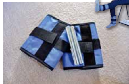
自分にあった重さのおもりをつけます