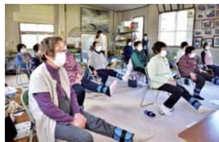
おもりを足や手に着けて行います