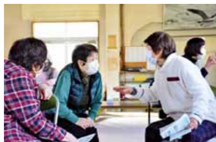
おしゃべりも楽しい♪