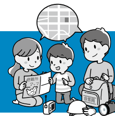
図 防災安全課 Tel 22-3721

近年、大雨による災害が長期化・激甚化するケースが増えています。いざというときに素早く避難行動ができるよう、梅雨を迎える前にハザードマップなどを活用して備えをしておきましょう。