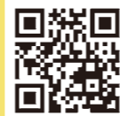
郷土資料館 X (旧Twitter)