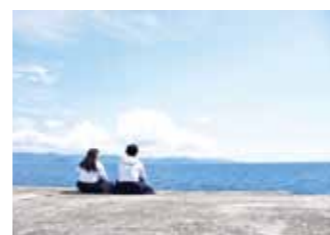
／CMみたいな写真が撮れました!／