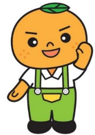
和歌山県有田市 マスコットキャラクター あり太くん (紀州有田商工会議所)

さらに、令和5年4月開校の和歌山医療スポーツ専門学校に連携いただき、フィギュアスケートの宇野昌磨選手専属のトレーナーが準備体操を担当します！完走後にランナーのケアサポートができるブースも設けています。