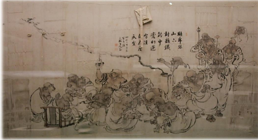
絹本淡彩 十六羅漢図 青木梅岳筆