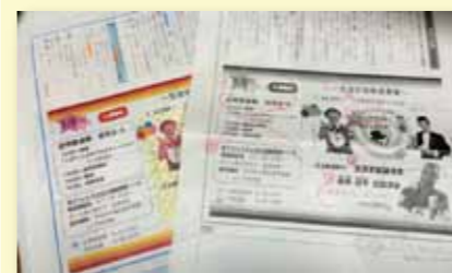
↑それぞれの原稿にはたくさんの書き込みが