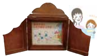
紙芝居：おおかみとしちひきのこやぎ 吉田 尚令/絵 教育画劇

利用者さんの声を受け、紙芝居の舞台の貸出を始めました。 2週間の貸出と予約が可能です! 借りたい方はカウンターにお問合せください!