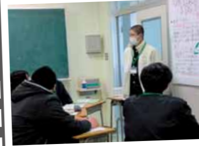
2学期は、SDGsに取り組む企業について学び、自分が大人になったときどんな働き方・生き方をしたいかについてポスターセッションを実施