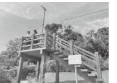
みかん海道展望台