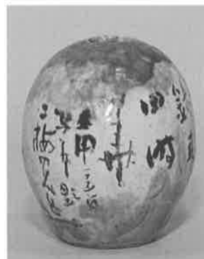
卵形花生 (個人蔵) 青木梅岳讃