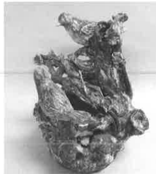
梅に鶯香炉 (個人蔵)