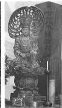
水難供養観音像 (個人蔵)