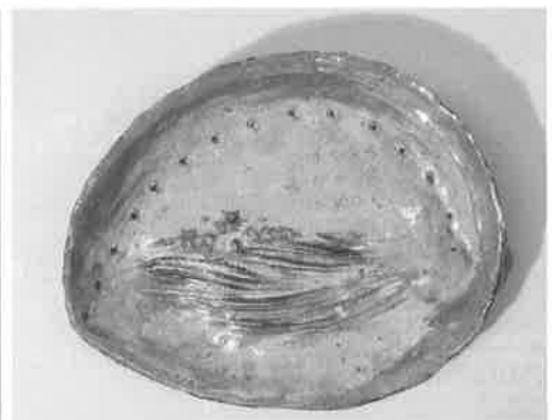
鮑形菓子皿 (個人蔵) 村上花月茶道華道披露記念