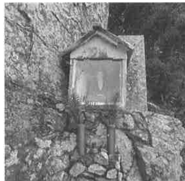
徳本上人像 (市指定史跡：徳本上人練行の遺跡)