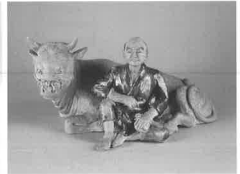
牛に農夫置物 (館蔵)