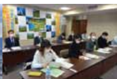
プレゼンテーション審査

2月19日（金）、農林水産大臣により「みかん栽培の礎を築いた有田みかんシステム」が、日本農業遺産に認定されました。400年以上にわたる試行錯誤によって生み出し、守り継いできた私達のシステムの価値が、広く認められることとなりました。これまで、有田地域全体で認定をめざし「審査委員 現地調査」や「プレゼンテーション審査」に挑んできました。