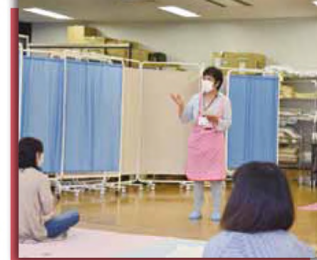
ほのぼのステーション