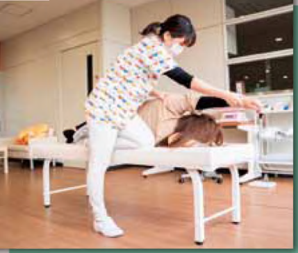
翠助産院でのケアの様子