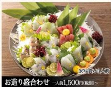
お造り盛合わせ 一人前1,500円(税別)~