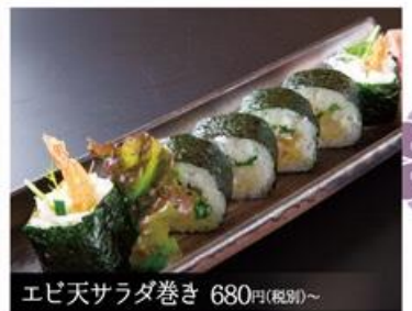
エビ天サラダ巻き 680円(税別)~