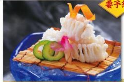
ハモ湯引き 900円(税別)