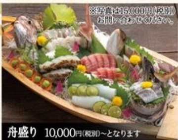
舟盛り 10,000円(税別)~となります