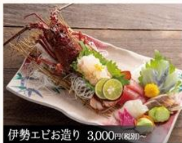
伊勢エビお造り 3,000円(税別)~