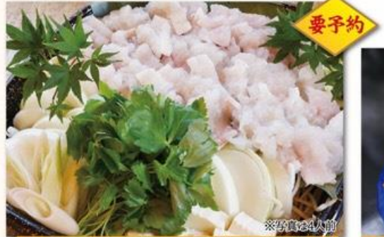
ハモ鍋セット 一人前3,000円(税別) 二人前から