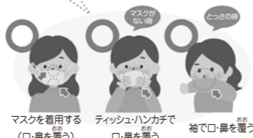
マスクを着用する（口・鼻を覆う） ティッシュ・ハンカチで口・鼻を覆う 袖で口・鼻を覆う