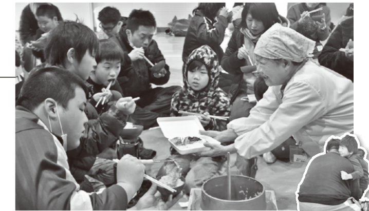
休憩時間のひとこま→ 箕島高校相撲部のお兄さんと嬉しそうに遊ぶ男子

小学生約80名が参加し、地域の方やボランティアの中高生の指導のもと、しば刈りや、釜戸で茶がゆを炊いたり、竹箆を手作りしたりしました。お昼には体育館で輪になって、あつあつのいも茶がゆをいただきました。