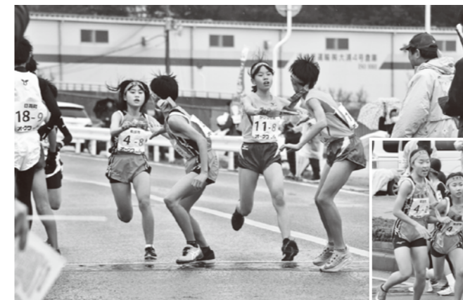
佐原姉妹の襷リレー→