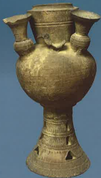
▲裝飾付須恵器壺 (一本松古墳出土、常楽寺蔵、市指定)