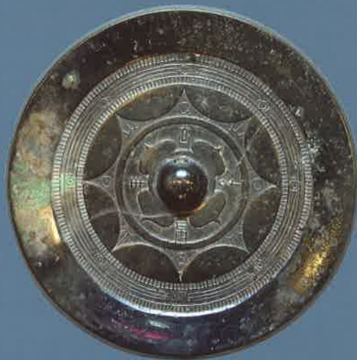
▲内行花文鏡 (伝宮原出土、円満寺蔵、県指定)