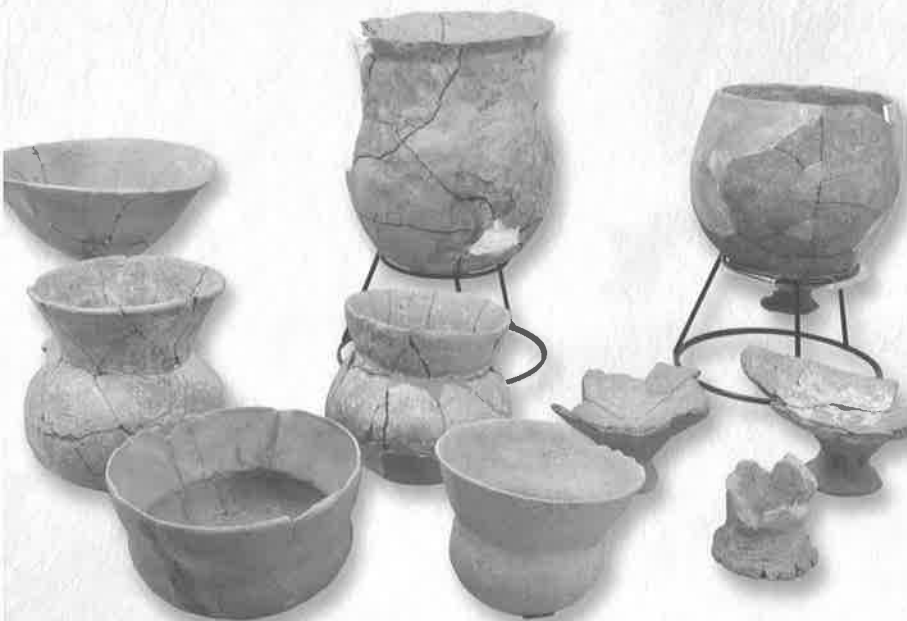
▲地ノ島出土遺物(館蔵)

多くの人がある歴史を忘れようと、 “有田”という地は、歴史があったことを忘れていない。