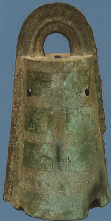
▲銅鐺(野井出土、個人蔵、県指定)