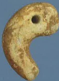
▲滑石製勾玉(星尾山遺跡出土、館蔵)