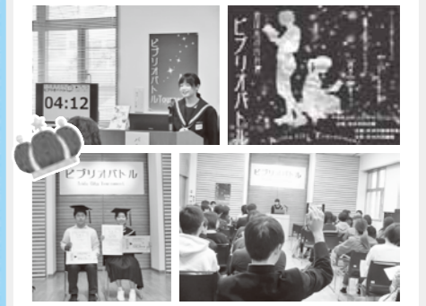
有田市からは2名が県大会に出場しました。