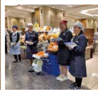
お客様に有田みかんをPR