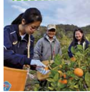
農家の方に教わりながらみかんの収穫