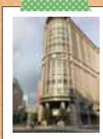
日本橋三越本店 有田みかんを販売