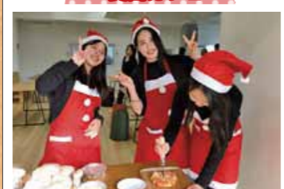
ピザを切り分けながら