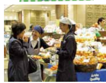
有田みかんが大好評！