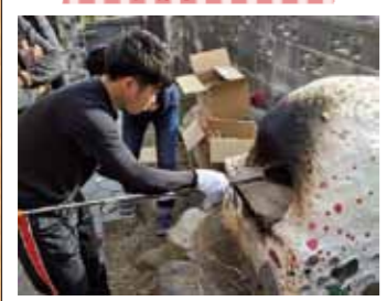
石窯でピザづくり