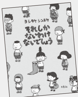
ヨシタケ シンスケ/作 白泉社