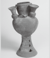
一本松古墳出土遺物 裝飾付須恵器壺(常楽寺) <有田市指定文化財>

発見された歴史資料を大切に後世へとつないでいく想いが、豊かな有田市の歴史を作り上げてきたとわかります。