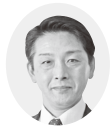
岡田 行弘 (公明党)