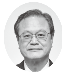
小西敬民 (日本共産党)

質 核兵器廃絶・平和都市宣言をもっとアピールすべき。有田市議会は1985年10月に、非核3原則の厳守と核兵器廃絶、平和都市とする宣言をしました。市長は、平和首長会議の一員として広く市民に広報すべき。