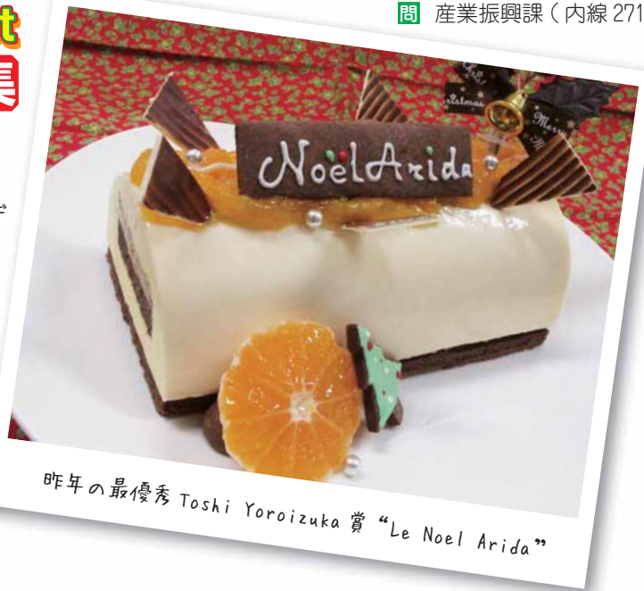
昨年の最優秀 Toshi Yoroizuka 賞 “Le Noël Arida”

開催日 / 11月9日（日） 場所 / イオンモール和歌山 表彰 / 最優秀賞賞金 10万円 優秀賞賞金 5万円 有田市長特別賞有田市認定みかん 5kg