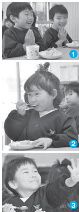
①手を合わせて「いただきます」②「あまくておいしい！」③「おかわりください〜」

昨年12月、ノエル・アリダ・スイーツコンテストでの最優秀作品「Le Noel Arida（ルノエルアリダ）」が市内保育所・幼稚園のおやつとして登場。子どもたちからは「おいしー」「もつと食べたい」と大好評でした。