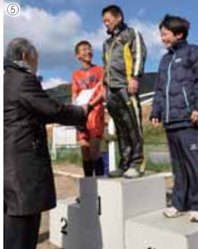
①緊張の瞬間(中学生女子) ②負けないぞ!(小学1年生) ③もうすぐゴール(小学4年生) ④初の表彰台(小学1年生女子) ⑤楽しかったね(小学6年生男子)