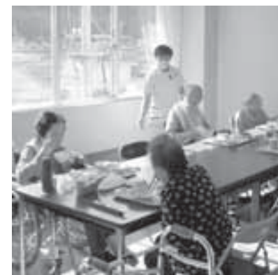
リラックスして食事ができます

日当たりの良いデイルームで、音楽を聴きながら患者様が集まって一緒に食事をします。音楽のリクエスト等にも対応しています。