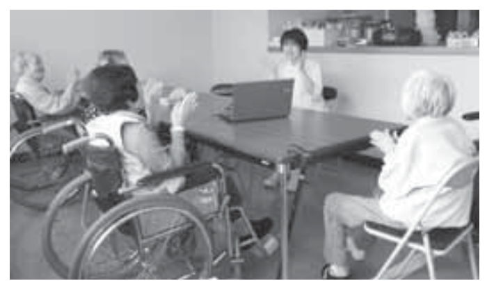
みんなで楽しむ健康体操