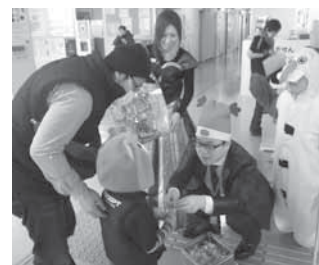
クリスマスのサプライズイベントの様子

募集要項は、有田市立病院のホームページに掲載しております。 http://www.ardaho.ardawakayama.jp