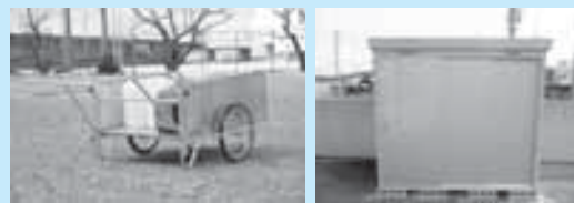
(上) 折りたたみリヤカー (右上) 防災倉庫 (右) 折りたたみ担架

※宝くじの社会貢献広報事業の一環として(財)自治総合センターコミュニティ助成事業を活用しました。