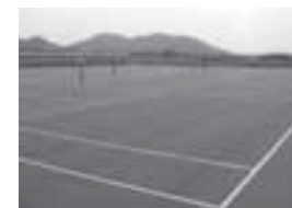
思い出のテニスコート

犬の散歩をするお年寄り、ウォーキングをする大人、ボール遊びをする子ども。ここは老若男女を問わずいろんな人が訪れる。そんな昔と変わらない風景を見ながら、「帰ってきたなあ」としみり。唯一変わった気がするの、思っていたより小さいこと。自分が大人になったからかもしれない。しみりする気持ちと共に、あの頃試合で訪れた記憶が蘇ってくる。ドキ