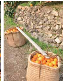
小道具のみかんかご