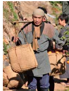
エキストラも活躍!