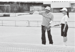
中学生に指導する様子

スポーツは無理をしなくても、自分のできる範囲で楽しめたいと思います。それぞれのスポーツを通じて仲間ができて、つきあいが広がります。自分にはないものを持っている人とたくさん会えるのが魅力ですね。