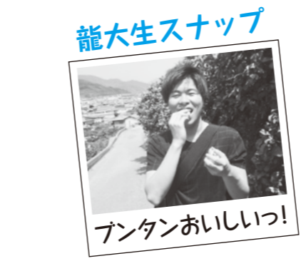
龍大生スナップ パンタンおいしいっ!

この花の活用方法について山 崎さん(うかがうと、独特な香 りと酸味があるみかんの花のは ちみつがあるということだ。 みかんの花は咲いてから10日 ほどで散ってしまうらしい。み かんの実がなる前のわずかな期 間に咲く花。これが持つ魅力を もっと多くの人に伝えられれば と思った。 今まで何度か有田市には訪れ ましたが、みかん畑に行ったの は初めてでした。山を登るとそ こからは有田市を見渡すこと ができ、山に囲まれ、その間を有 田川が流れている景色はとても 綺麗でした。いつまでも眺めて いたいと思いました。食べさせ てもらったパンタンはとてもお いしく、有田の豊かな自然の恵 みを体全体で感じる事ができ ました。