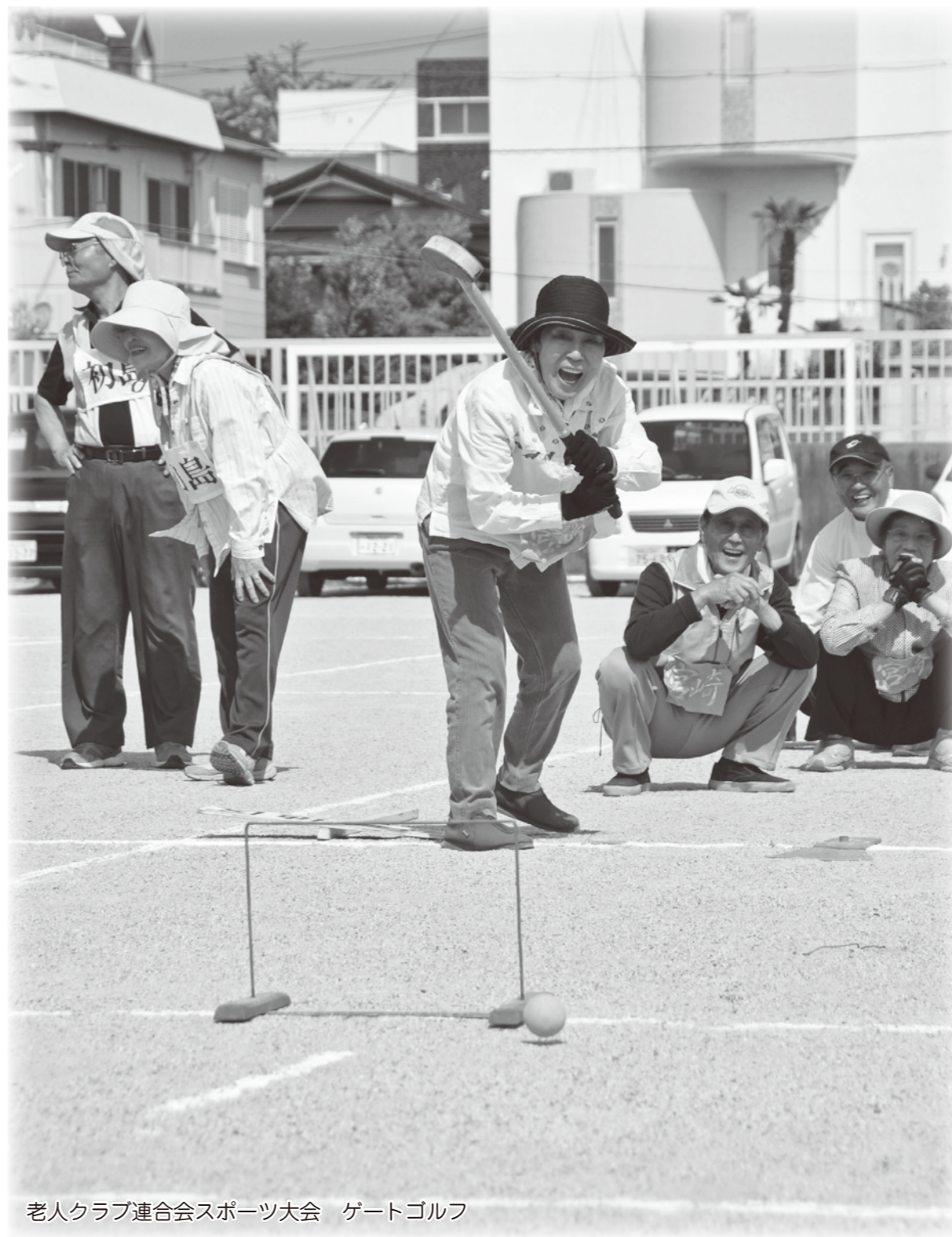
老人クラブ連合会スポーツ大会 ゲートゴルフ