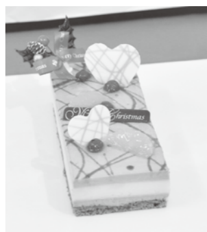
昨年の最優秀Toshi Yoro izuka賞「アムール ドノエル アリダ」

「ノエル・アリダ・スウィーツコンテスト2016」& 「有田みかん×焼き菓子コンテスト」 出場作品大募集!