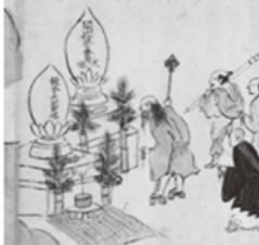
徳本の剃髪の師、大円の墓を訪れる徳本(徳本上人縁起絵巻)<往生寺蔵>