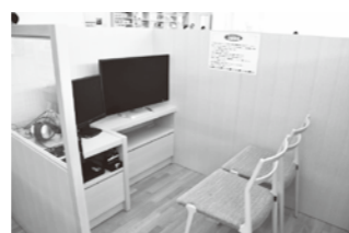
DVDも充実させました。 半個室型のAVコーナーでゆっくりご鑑賞ください。