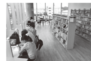
ヤングアダルトコーナー 十代の皆さんに好まれる本 をとりそろえています。