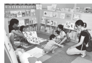
わくわくのもり お子様が靴を脱いで、ゆっ たり絵本とふれあえます。