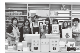
サービスカウンター