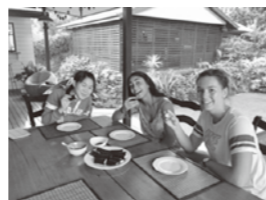
イタリアやドイツからの留学生と一緒にホームステイ

本語教育が盛んでした。ジブリのキャラクターを描いた壁があつたり、廊下を歩いていると日本語で話しかけられる事もありました。また、ケアンズ高校には様々な国から来た留学生がいました。どの国の人も英語を話していました。やはり他国の人と会話をし、意思疎通するには英語が必要だと実感しました。これからの学校生活で以前より英語の学習に力を入れていこうと強く思いました。