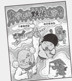
こもり かおり 小森 香折 / 文 にしむら しげお 西村 繁男 / 絵 アリス館

小学校で2020年度から必修化されるプログラミング教育。家庭でのプログラミング教育のやり方のポイントや、民間教室の活用法などを掲載しています。今を生きるうえで重要となっているプログラミング教育について先取りしませんか？