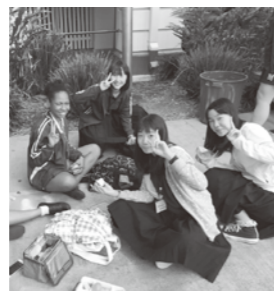
バディと一緒にランチタイム

本語教育が盛んでした。ジブリのキャラクターを描いた壁があつたり、廊下を歩いていると日本語で話しかけられる事もありました。また、ケアンズ高校には様々な国から来た留学生がいました。どの国の人も英語を話していました。やはり他国の人と会話をし、意思疎通するには英語が必要だと実感しました。これからの学校生活で以前より英語の学習に力を入れていこうと強く思いました。