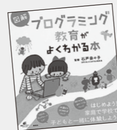
いしど なるこ 石戸 奈々子 / 監修 講談社