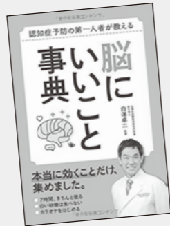
しらさわ たくじ 白澤 卓二 / 監修 西東社

「風の谷のナウシカ」から「風立ちぬ」まで、宮崎駿監督の10作品の主要モチーフである「風」「森」「城」「海」などを哲学し、我々が生きる現実世界の本質を解き明かしてくれる新感覚の一冊。