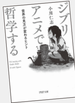
おがわ ひとし 小川 仁志 / 著 PHP 研究所