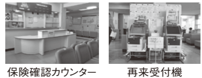
保険確認カウンター