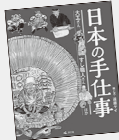
えんどう 遠藤ケイ / 絵と文 汐文社

コーディネート最後にひと巻きするだけで、暖かく、印象をガラリと変えてくれるストール。流行に左右されないストールの巻き方やコーディネートを紹介しします。