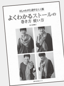
いしだじゅんこ 石田純子 / 監修 主婦の友社