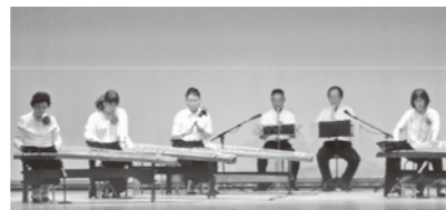
いとたけかい ARIDA系竹会

平成11年の結成以来、日本古来の伝統楽器である琴、三絃、尺八による演奏を通じて、伝統芸術の維持、発展、普及に絶大な貢献をされている。小中学校へ赴き、演奏を披露する他、生徒自ら琴に触れて、演奏する機会を設けるなど、伝統楽器の魅力を広めている。また、箕島高校では長年にわたり生徒への指導を行い、邦楽愛好家の育成に努めた。また、オレンジコンサートや有田市芸術大会へは毎年出演されるなど、継続的に活動されている。