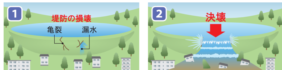
大きな地震、大雨等で堤防が損壊（亀裂や漏水） 破損した堤防が貯水に耐え切れず「決壊」 堤防前面の滑落箇所から漏水など